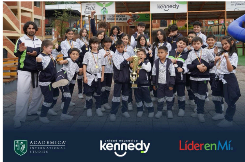
El liderazgo en el Kennedy se vive desde los primeros años de escolaridad

Hoy, desde los primeros años de escolaridad, los estudiantes comienzan a rozar una de las revelaciones más decisivas de su formación: que dentro de ellos habita un potencial silencioso, vasto, casi latente, esperando ser descubierto. No se trata únicamente de reconocer que tienen voz o que pueden tomar decisiones; se trata de comprender que su existencia misma tiene la capacidad de incidir, de transformar, de dejar huella en el mundo que los rodea.