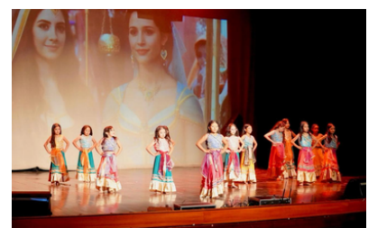
Campeones en deporte y liderazgo en expresión artística · Unidad Educativa Kennedy