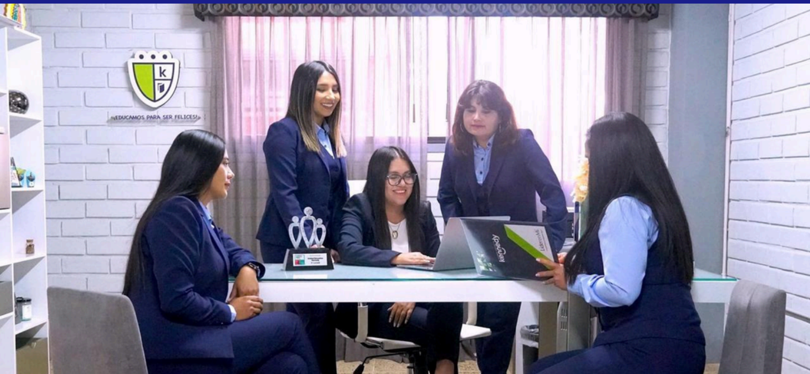
Unidad Educativa Kennedy · Cuenca, Ecuador · Centro Líder en Mí