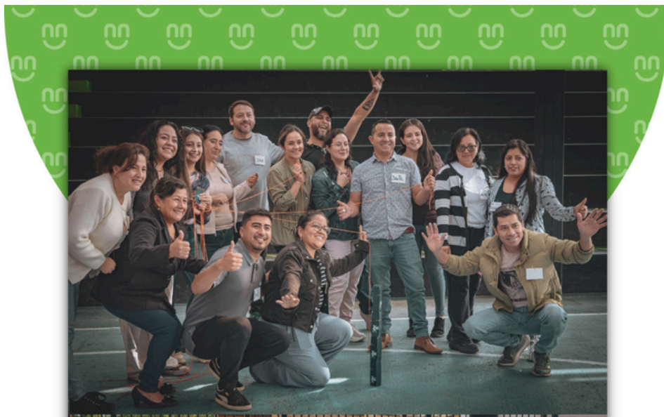
La comunidad del Kennedy comparte una vision, un lenguaje y un proposito

Hoy, en el Kennedy, los estudiantes, docentes y familias comparten una misma vision. Se comunican, reflexionan y actuan desde los habitos, fortaleciendo una cultura de empoderamiento y responsabilidad que trasciende las aulas y se instala en la vida.