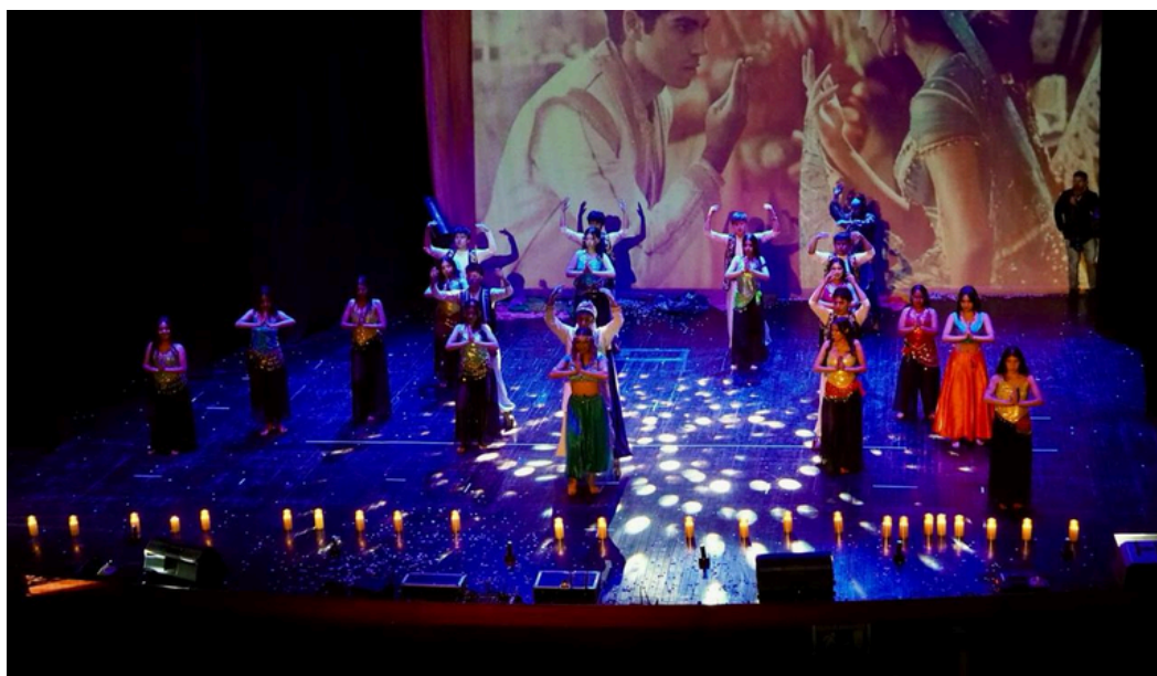
Unidad Educativa Kennedy · Centro Lider en Mi · Cuenca, Ecuador