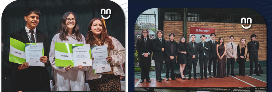
Estudiantes del Kennedy liderando en escenarios locales e internacionales

Las victorias públicas del Kennedy no están escritas en la pared de los trofeos. Están escritas en la manera en que sus estudiantes caminan por el mundo: con propósito, con hábitos y con la certeza de que tienen algo valioso que aportar.